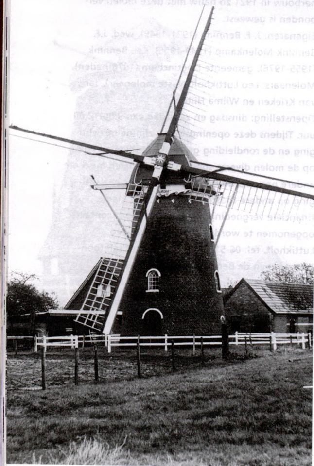
De Aurora in Dichteren, ook wel de molen van Harbers genoemd, vroeger. Toen stond de molen nog in het open veld, nu is zij voor een belangrijk deel ingebouwd. (Foto Staring Instituut).

Op het industrieterrein Grutbroek zijn twee straatnamen, die onze herinnering aan de vroegere zaagmolen levend houden, namelijk Houtmolenstraat en Zaagmolenpad. Deze molen bevond zich tussen de IJsselstraat en de Nemaho, nabij de Oude IJssel. Vroeger gingen veel Doetinchemmers zwemmen en roeien in de Oude IJssel bij Smeitink; ca. 150 meter verderop stond een groepje woningen bijeen, waarvan de bewoners een hechte gemeenschap vormden. Deze gemeenschap werd in de