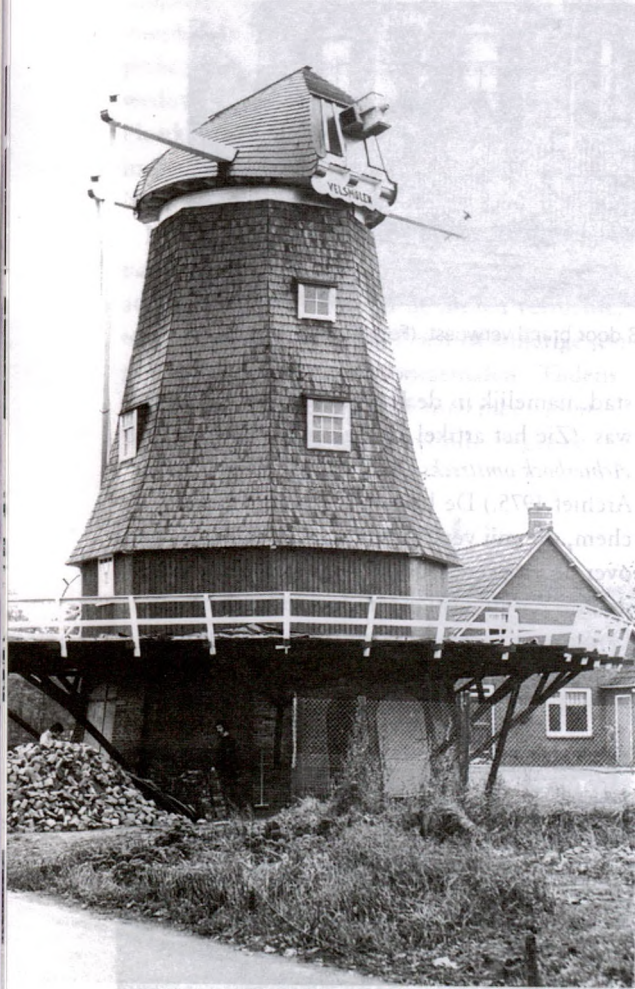
De Bennink- of Velsmolen aan de Varsseveldseweg zonder wieken, wachtend op de restauratie die op 14 juni 1980 met de officiële ingebruikname werd afgerond.

Na 1794 verviel dus de watermolen te Gaanderen weer, nog kan men thans de plaats ervan aanwijzen, achter de boerderij De Koepel , ongeveer vijftig meter beneden de brug over de beek. De Oudheidkundige Vereniging Gaanderen heeft op de plek een gedenksteen doen plaatsen. De molen lag op de linkeroever van de beek en in het weiland ter plaatse vindt