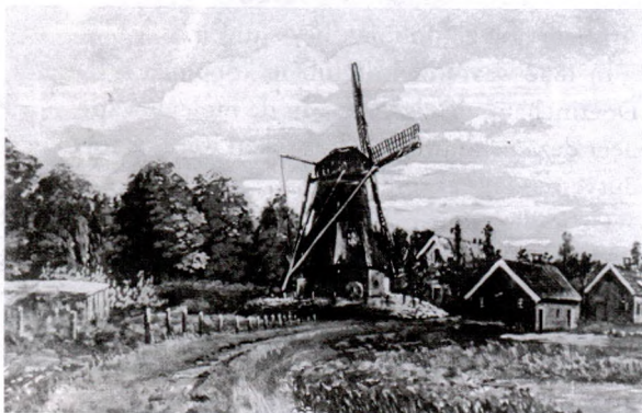
De molen van Coops tussen de Ds. van Dijkweg en de IJkenbergerweg in 1908. Omstreeks 1915 is deze molen afgebroken (Foto Staring Instituut).