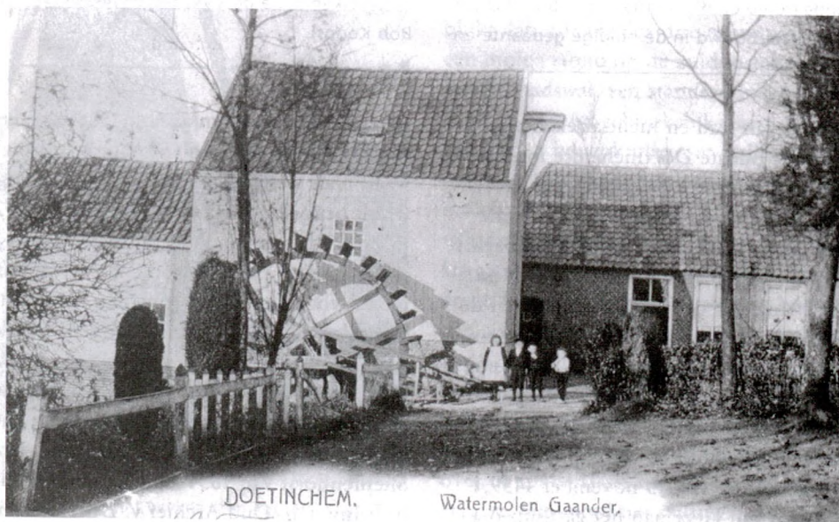
De watermolen aan de Bielheimerbeek bij Gaanderen die in 1919 werd gesloopt.

De mulder redde zich door ijlings tegen de wind in te lopen, maar de beide burgers, dit zo spoedig niet bedenkende, hoewel zij er tevoren voor waren gewaarschuwd, liepen voor de wind af en werden door de neerstortende molen verpletterd. Als wonderlijke speling van het lot bleef de in de molen aanwezige knecht Dirk, die ermee omviel, gespaard en liep slechts lichte verwondingen aan een been op. Wel zat hij zo tussen het houtwerk ingeklemd, dat hij er uitgezaagd moest worden. Deze molen was een zogenaamde standerdmolen, een houten rechthoekige kast, rustende op een drietal steunen. Dit soort molens overkwam steeds weer het lot van omwaaien en uit bovenstaande kunnen we wel opmaken, dat het beroep van molenaar nog niet zo ongevaarlijk was.