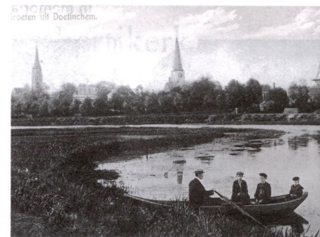
Idyllisch plaatje van Doetinchem zo'n eeuw geleden. (Foto Staring Instituut).

Doetinchem krijgt een molendag. Het bestuur van de Stichting Doetinchemse Molens heeft hiertoe besloten om de drie molens nog meer onder de aandacht van de bevolking te brengen. Begin mei is er elk jaar een landelijke fiets- en molendag. Het accent is bij dit evenement steeds meer op het fietsen en steeds minder op de molens komen te liggen. In andere provincies is men er al eerder toe overgegaan een provinciale molendag in het leven te roepen. In Gelderland bestaan daarvoor geen plannen maar de Stichting Vrienden van de Gelderse Molens heeft te kennen gegeven plaatselijke initiatieven te willen ondersteunen door die te vermelden in het kwartaalblad van de stichting.