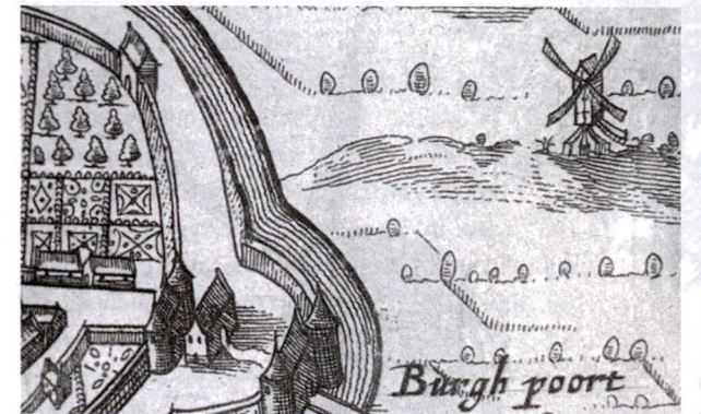
De molen van Sagleven, zoals die voorkomt op de kaart van Nicolaas van Geelkerken uit plm. 1640.