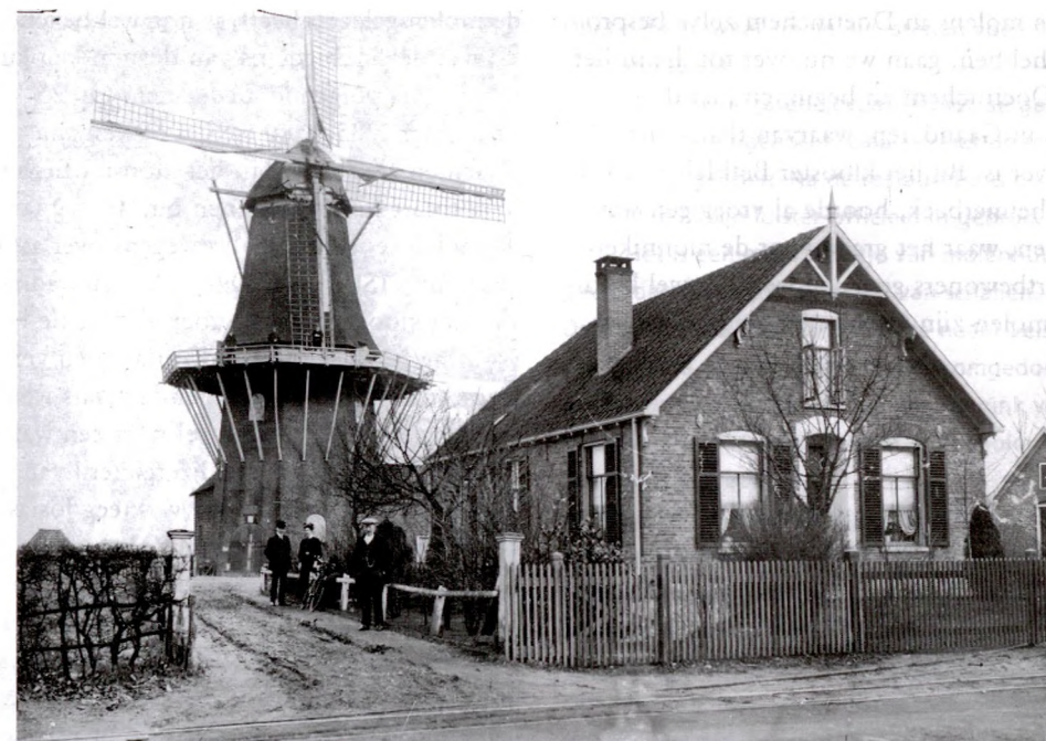
De molen van Sagleven aan de Terborgseweg, in 1918 door brand verwoest.

Als opvolger van de omgewaaide molen werd de molen Aurora gebouwd, ook een standerdmolen, doch deze moest na zeventig jaar door de inmiddels hoog opgeschoten bomen rondom, worden afgebroken. In 1871 werd hij naar Dichteren overgebracht en met de materialen ervan werd de tegenwoordige molen Aurora aldaar gebouwd.