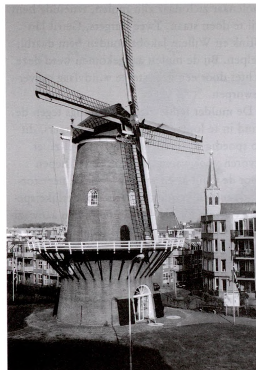
De Walmolen is een ronde stenen bovenkruier met stelling en heeft een vlucht van 23 meter. De voorganger van deze molen was, zoals bijna altijd, een standaardmolen die in 1850 door brand is verwoest. Hij is herbouwd in de huidige gedaante en