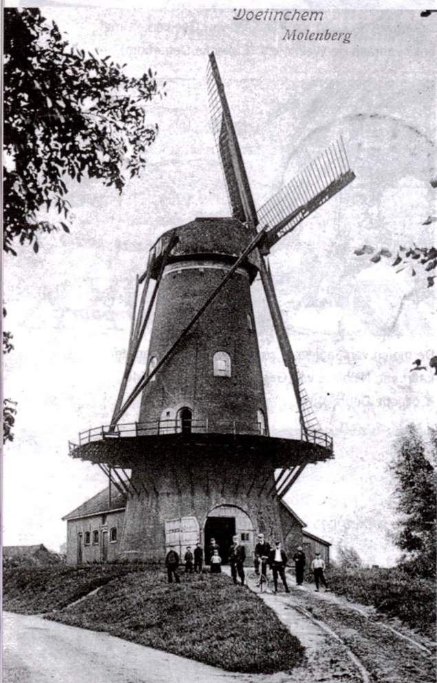
De Walmolen, nog met wieken, aan het begin van de twintigste eeuw (Foto Staring Instituut).

De Walmolen, de molen van Becking, is na de restauratie zo'n beetje het beeldmerk van Doetinchem geworden. Uit de plattegrond van Doetinchem door Slichtenhorst (1654) blijkt dat er toen, dus drie eeuwen geleden, al een molen stond op de zuidoostelijke hoek van de stadswal, een standerdmolen uiteraard zoals in die tijd gebruikelijk was. Later is er een stenen bovenkruier met stelling voor in de plaats gekomen, met rieten kap, en deze molen staat er thans nog. In de jaren zestig van de vorige eeuw werd besloten de Walmolen te slopen omdat omstreeks 1910 de wieken ervan waren verdwenen. Gelukkig heeft toen een actiecomité uit de burgerij onder leiding van G.J.B. Stork ervoor gezorgd, dat restauratie kon plaatsvinden. In 1965 kon de walmolen weer in oude glorie herrijzen, zodat de bezoeker van Doetinchem, die de stad van over de Oude IJssel nadert, thans weer ervaart, hoe mooi het stadsgezicht met rivier en molen is, nu een wiekenkruis zich tegen de