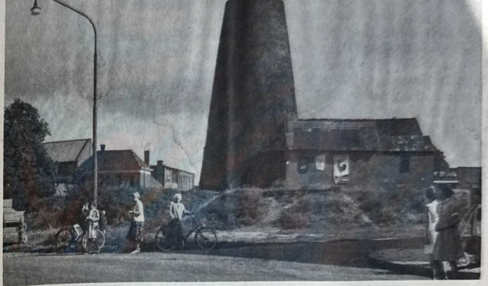
Walmolen circa 1915, dus met ontweekte romp, collectie Stork

Een tweede waterradmolen, de latere stads-waterradmolen, lag aan de uitmon-ding van de Slinge, Deze beek stroom-de vroeger door de stad, kruiste de Kapoeniestraat en viel even beneden de IJsselbrug in de Oude IJssel. Op een kaart van Slichtenhorst (1654) wordt deze watermolen getekend. Ds. K. H. Greven schreef in 1829 nog dat het